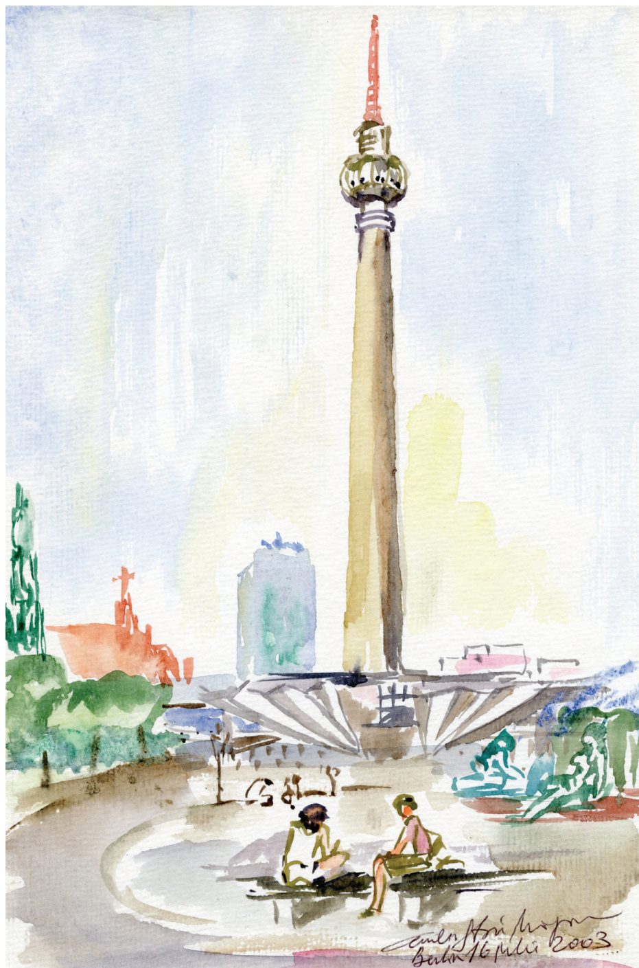
02. Turnul Televiziunii, Berlin