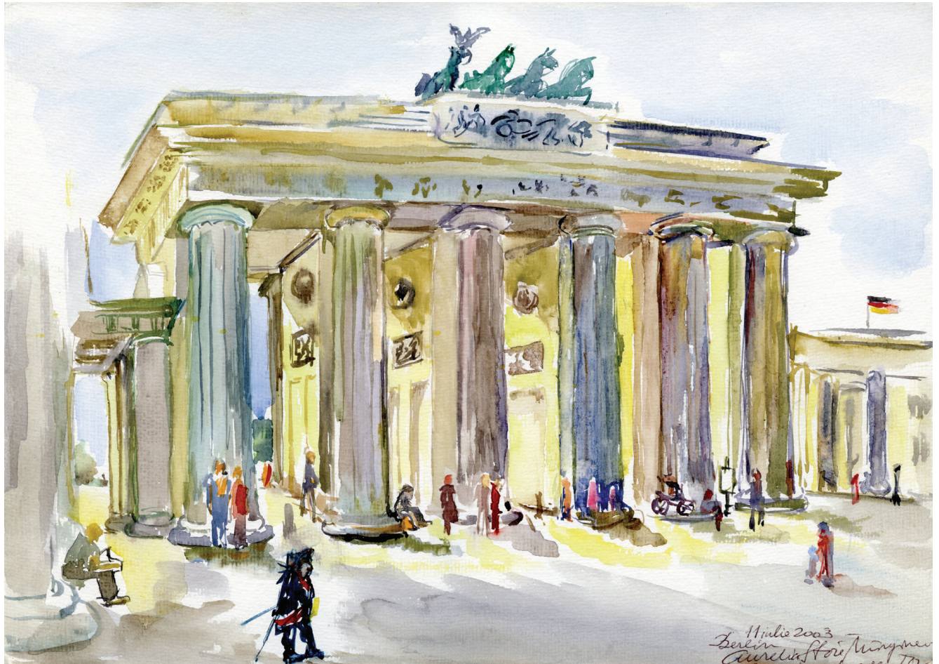
03. Brandenburger Tor, Berlin